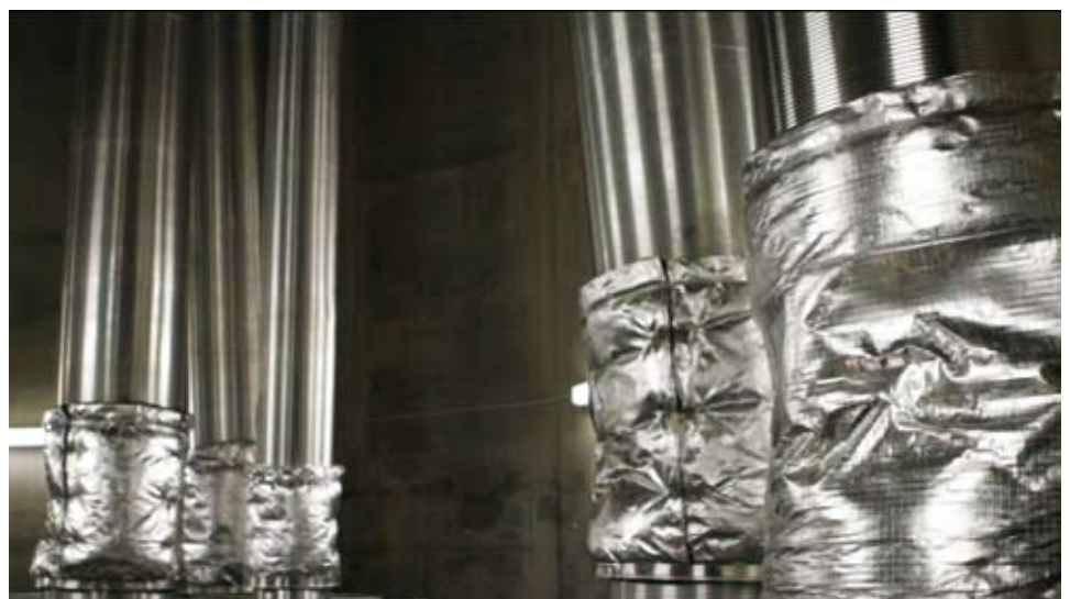
Med fjernkølingsløsninger kan slutbrugere slippe for at skulle lægge rum til pladskrævende og støjende kompressorer, fordi de kan koble sig på en stor fjernkølingscentral.

Når en lokal system-løsning er identificeret, og beslutning om etablering er truffet, skal screeningen følges op med detailprojektering og prissætning